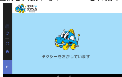
▲ タクシー呼び出し機能