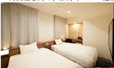
▲ 客室設置イメージ

イータブ・プラスは、今後も機能拡充やホテル独自サービスへの対応により、宿泊者の客室内での利便性を高め、旅行やホテル運営全般を支援するサービスを目指してまいります。