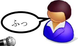
iPad 対応の市販マイク

②入力したい文字が含まれている所にカーソルが合った時に息を吹きます。「や」を入力する場合、5回目の点滅で息を吹きかけます。